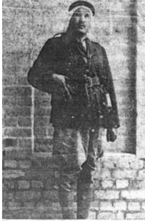
الشهيد القائد حسن سلامة